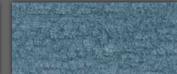
14 Sky Blue